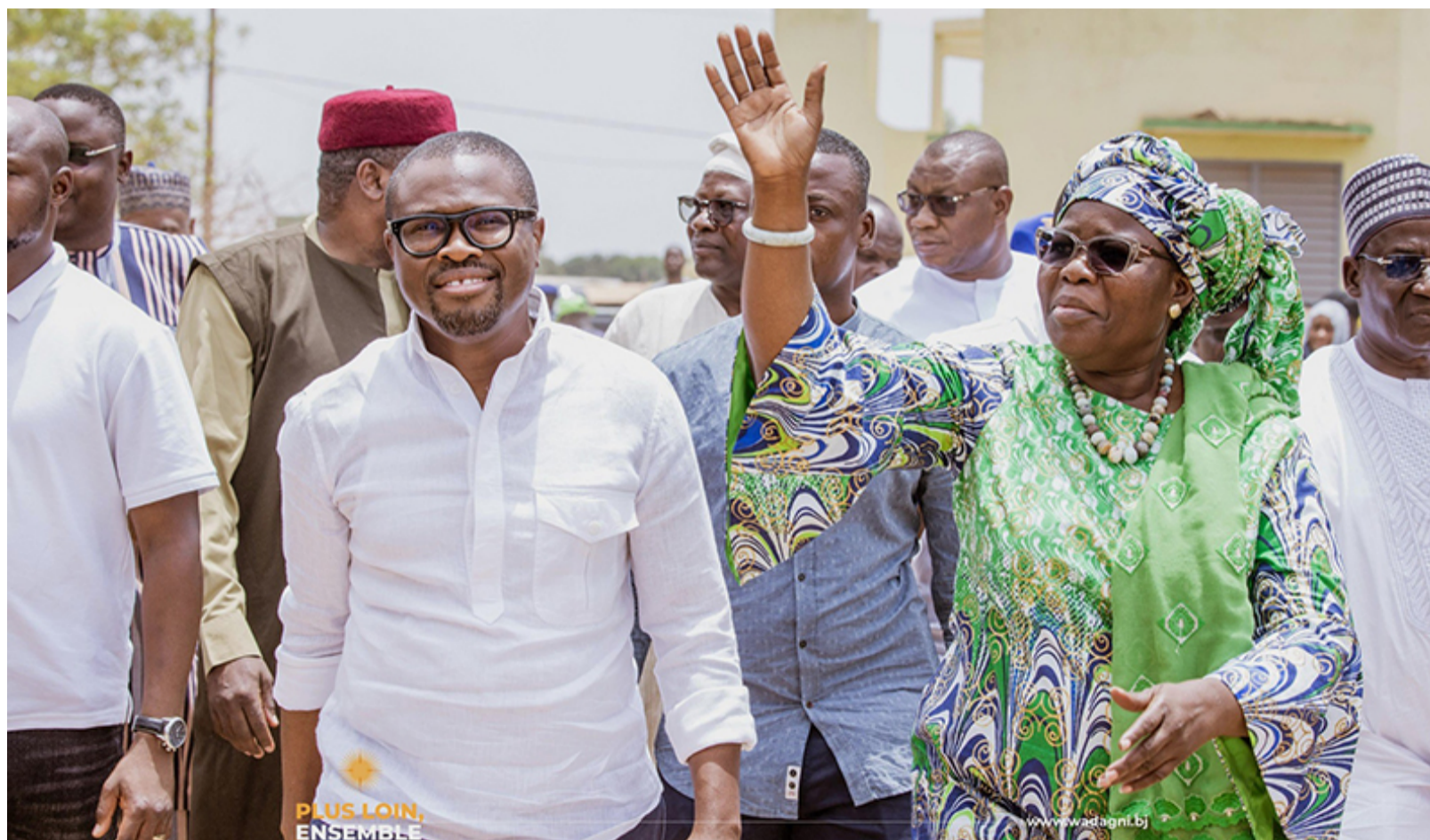
Mariam TALATA en campagne électorale aux côtés du candidat Romuald WADAGNI

lente construction. Elle a débuté en politique dès 2001, a été conseillère municipale à Parakou, puis députée et première vice-présidente de l'Assemblée nationale avant de devenir vice-présidente de la République. La Présidence a aussi mis en avant, en mars 2026, un bilan jugé très satisfaisant de son mandat à la tête de la Grande Chancellerie