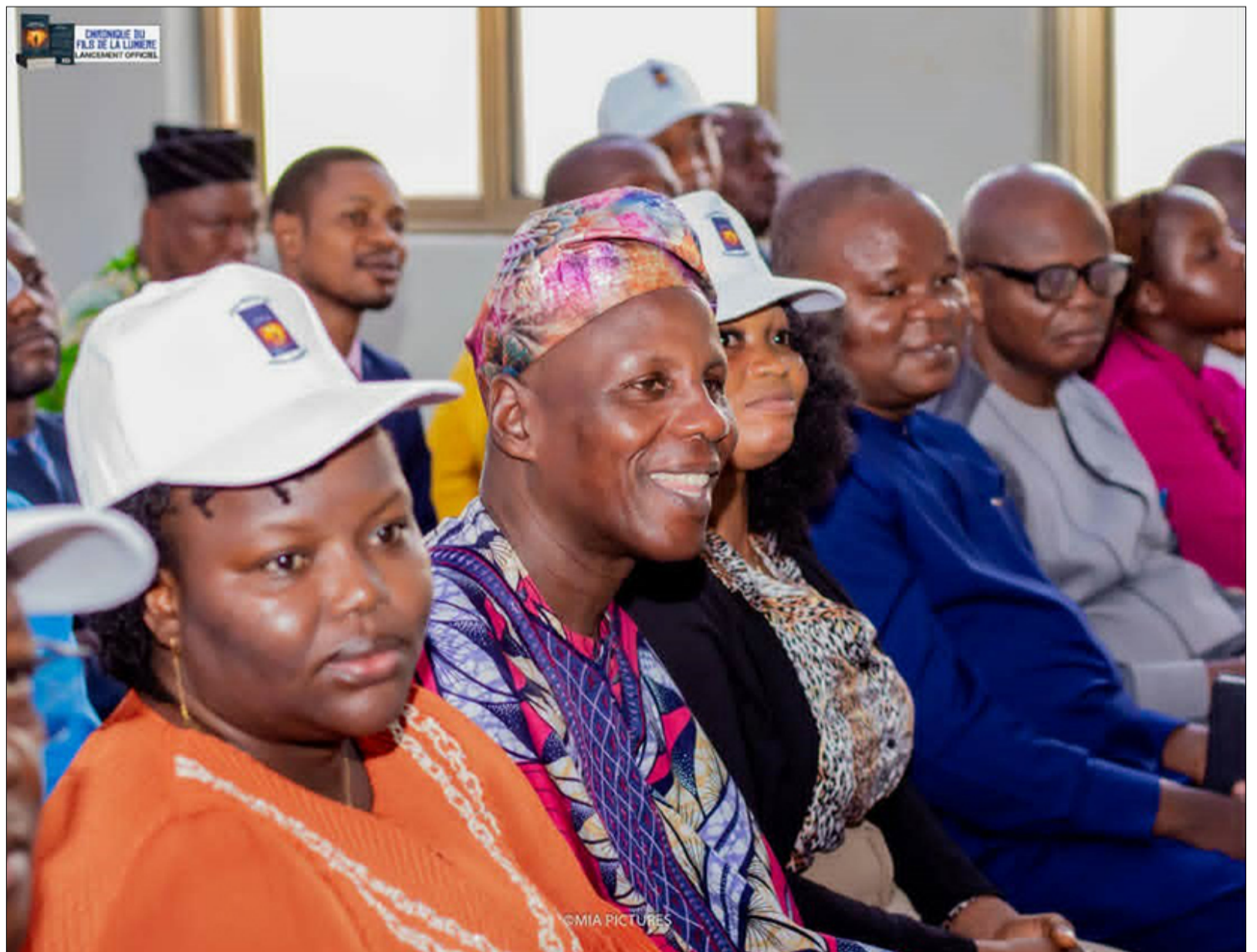
Un public séduit par la qualité du roman Chronique du fils de la lumière

À travers ces regards croisés, une évidence s'impose, Chronique du Fils de la Lumière