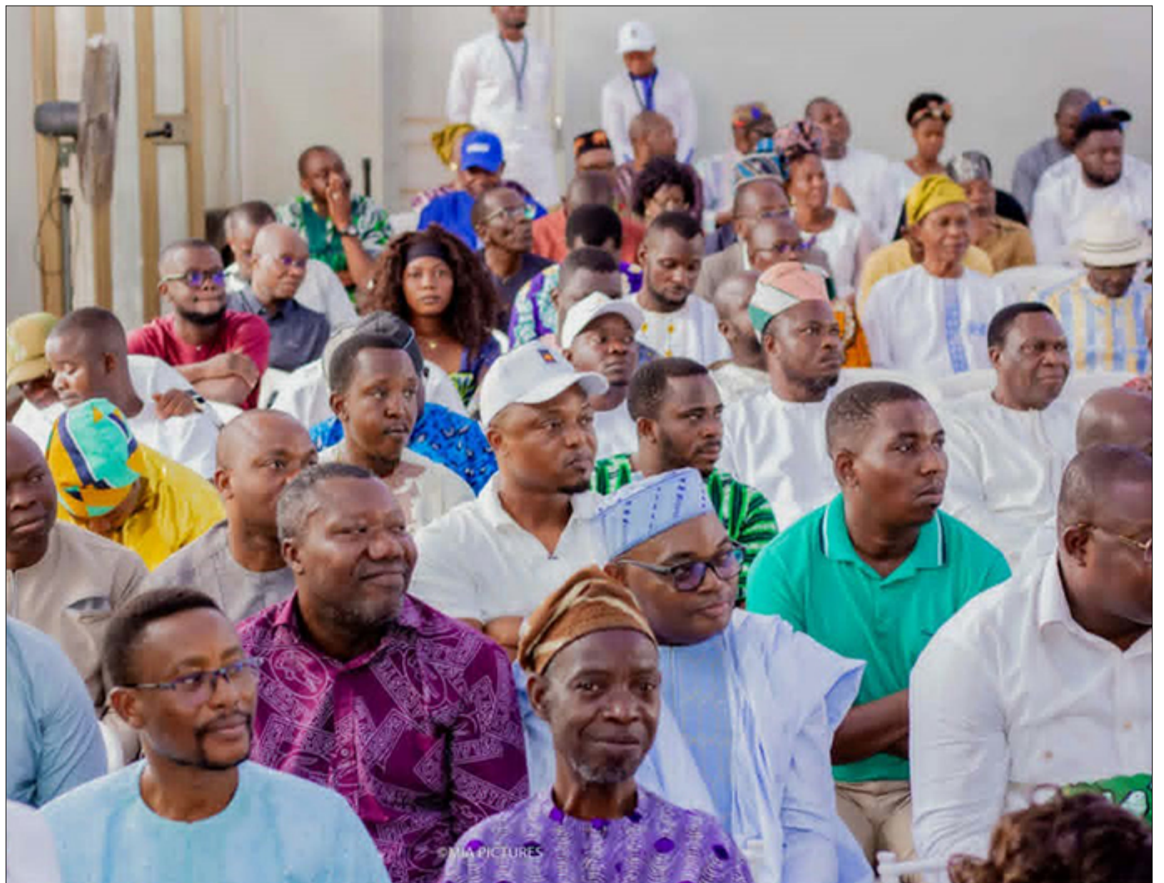
Un public séduit par la qualité du roman Chronique du fils de la lumière

Et dans une phrase appelée à marquer durablement les esprits, il a tracé une ligne éthique