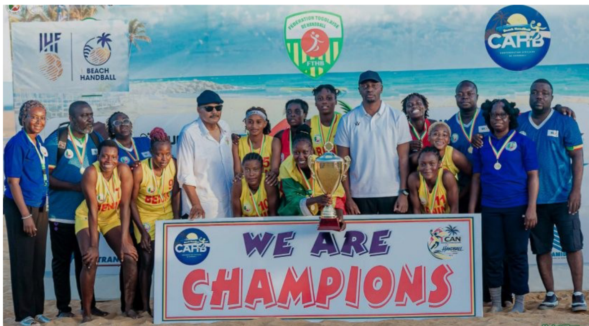
Photo de famille des Amazones à l'issue de la CAN Seniors de beach handball

En finale, face au Togo, le scénario a gardé une tension constante. Après deux manches partagées, tout s'est joué aux shoot-out, et les Amazones ont gardé la tête froide pour s'imposer 6-5. Cette maîtrise dans l'instant décisif dit